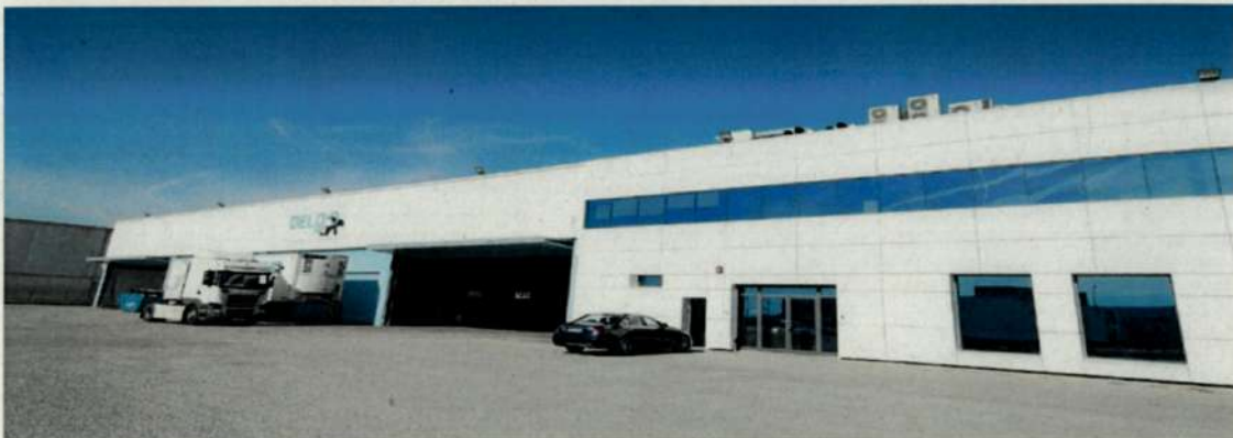
Vista general de la instalación

El incremento de plantilla que hemos tenido en este año 2023 nos ha obligado a ocupar ya la totalidad del espacio que teníamos disponible para oficinas.