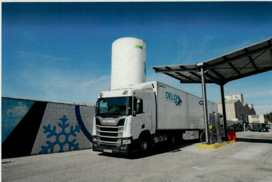
Punto de repostaje