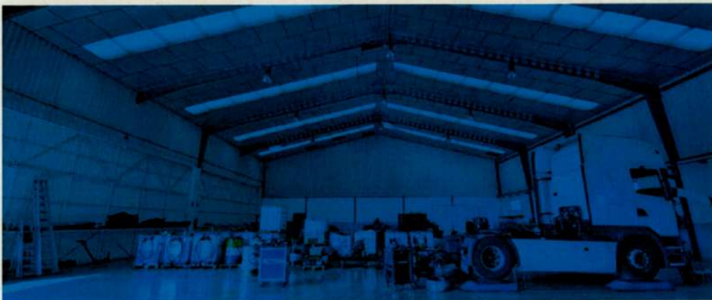
Interior del taller

Las oficinas son espaciosas, dotadas de moderno mobiliario, buscando un entorno de trabajo confortable.