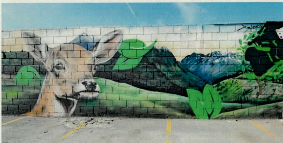
Imagen del interior de nuestro vallado perimetral Expresión cultural

Al vallado perimetral se le ha dado un fin adicional al esencial de garantizar la seguridad; se ha utilizado como medio de expresión cultural para mejora su impacto visual.