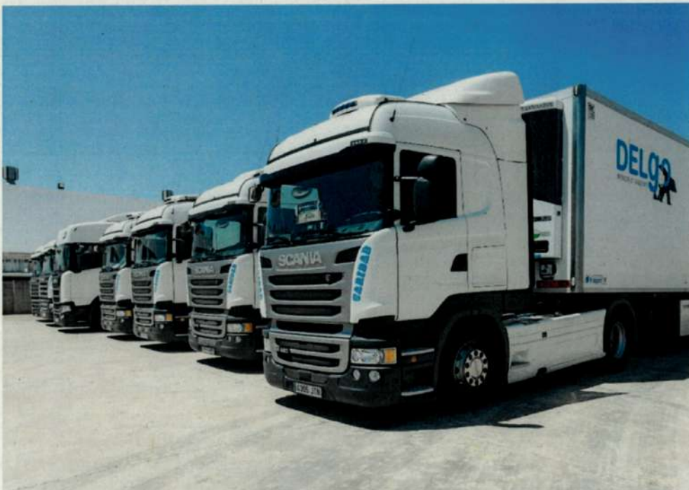
Imagen de la zona de aparcamiento de camiones

Nuestro aparcamiento está totalmente pavimentado para evitar que cualquier derrame eventual por pequeño que sea puede provocar una contaminación del suelo o filtración a acuíferos.