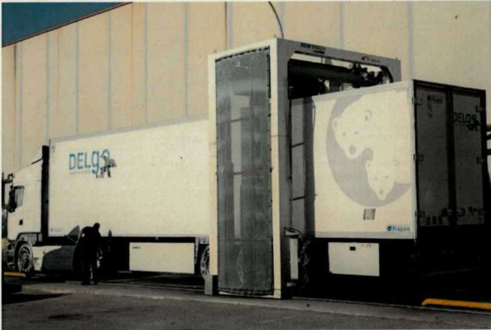
Tren de lavado