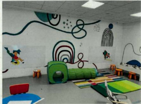
Sala infantil en las instalaciones de Massalfassar

Hemos considerado indicadores asociados al crecimiento de plantilla (indicador 017), los permisos parentales (indicador 018), la diversidad e igualdad (indicador 024) y la discriminación (indicador 025).