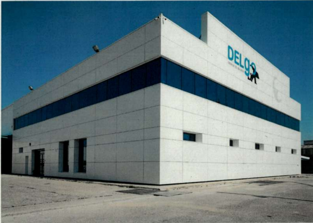
Edificio de oficinas

Las oficinas son espaciosas, dotadas de moderno mobiliario, buscando un entorno de trabajo confortable.