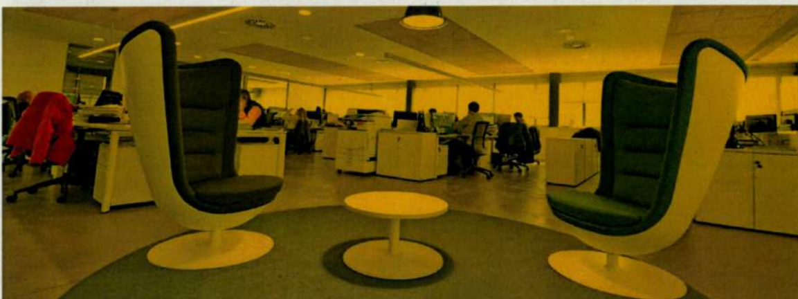
Interior de las oficinas